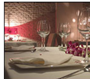
Restaurante Dassa Bassa