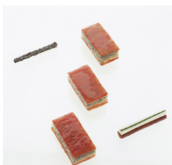
Tomate mi-cuit, caviar y ostras en su jugo- La Broche