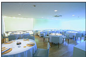
Restaurante La Broche