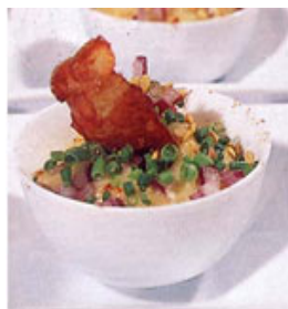
Humus de Balzac